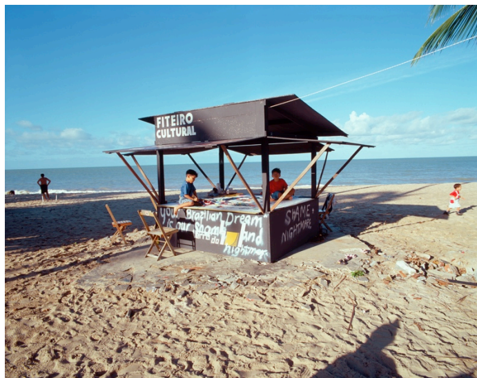
Fiteiro Cultural, João Pessoa. Exposition Laboratoire , 1998.

A l'invitation d'artistes ou de commissaires, en relation avec un lieu dédié à l'art, Fiteiro Cultural a été installé tout autour du globe: Brésil, Grèce, Suisse, Arménie, Etats-Unis, Cuba, Portugal, France, Italie, Palestine et Allemagne. Chaque nouveau Fiteiro Cultural a ainsi été la rencontre de l'artiste avec un nouveau lieu, de nouvelles institutions et de nouvelles cultures, à des modes de construction du kiosque différents, et surtout, à de nouveaux types de collaboration avec les artistes qui proposaient des stratégies et des manières inédites d'interpréter l'œuvre. Fiteiro Cultural est donc une pièce en constant changement, sans début ni fin, sans évolution ni forme idéale. La découverte de l'autre faisant partie intégrante de l'œuvre, l'artiste l'appréhende en tant que « sculpture sociale ». Le Fiteiro est un « non-lieu » qui, pour exister, dépend de la communauté dans laquelle il est installé. A chaque nouvelle construction, il positionne ainsi l'artiste en tant que spectatrice de sa propre œuvre.