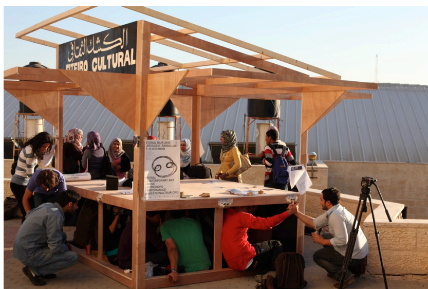
Fiteiro Cultural, Festival, Eternal Tour 2010. Université Al-Quds, Jérusalem, Palestine, 2010.

Dans ce contexte d'incertitudes, l'artiste explique penser qu'il y a de moins en moins de possibilités pour des projets comme celui de Fiteiro Cultural. Symboliquement, le projet a terminé son parcours physique en Palestine, à Jérusalem, point décisif dans le travail de Fabiana de Barros, constatant alors une évidence: les changements se produisant dans le monde ainsi que leurs urgences, ne sont plus les mêmes qu'au commencement du projet.